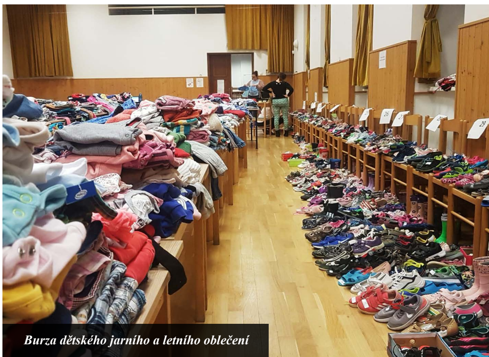
Burza dětského jarního a letního oblečení