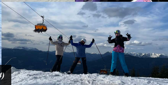
Zájezd na Stuhleck (3. března 2024)