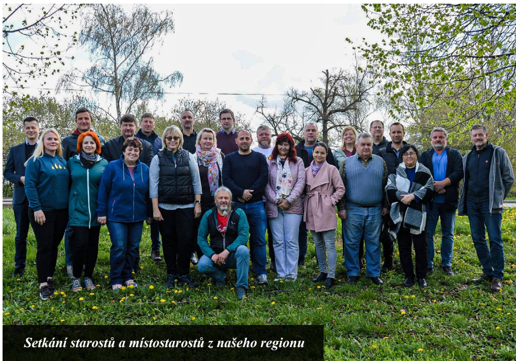
Setkání starostů a místostarostů z našeho regionu